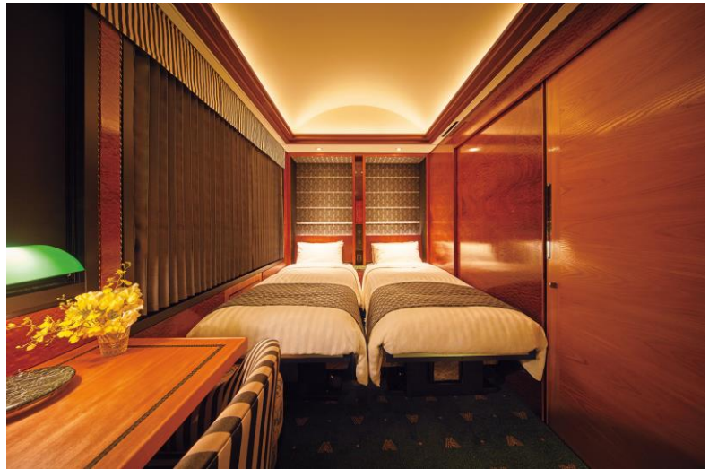
西川リビングのベディングが採用されたロイヤルツイン客室