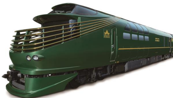
「TWILIGHT EXPRESS 瑞風」車両

創業 451 年目を迎えた寝具・寝装品メーカーの西川リビング株式会社(本社:大阪市中央区 代表取締役社長 西分平和)が提案する、上質かつ安全性の高いベディングシリーズが、2017年6月17日(土)より運行をスタートする西日本旅客鉄道株式会社(以下、JR西日本)の「TWILIGHT EXPRESS 瑞風」の全客室に採用されました。