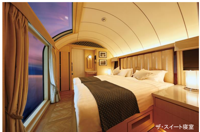
ザ・スイート寝室